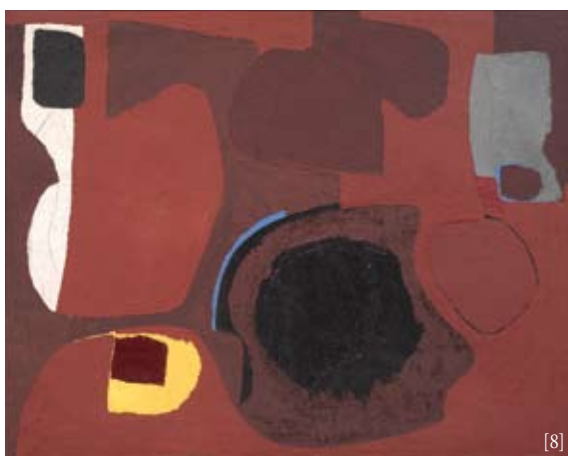
[6] Alighiero Boetti, "Alternandosi e dividendosi" 1989, ricamo, cm 102x107 [7] Lorenzo Viani, "Uomini sulla panchina" 1907-1909, olio su cartone, cm 75x106 - [8] Alberto Burri, "Catrame", 1950 catrame e olio su tela, cm 65x80 [9] Emilio Vedova, "Scontro", 1953 tecnica mista su masonite, cm 50x70